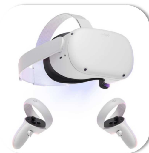
A gauche : Participant assis dans le kayak. A droite : le matériel de RV utilisé : le visiocasque Meta Quest 2 et ses contrôleurs les Meta Touch