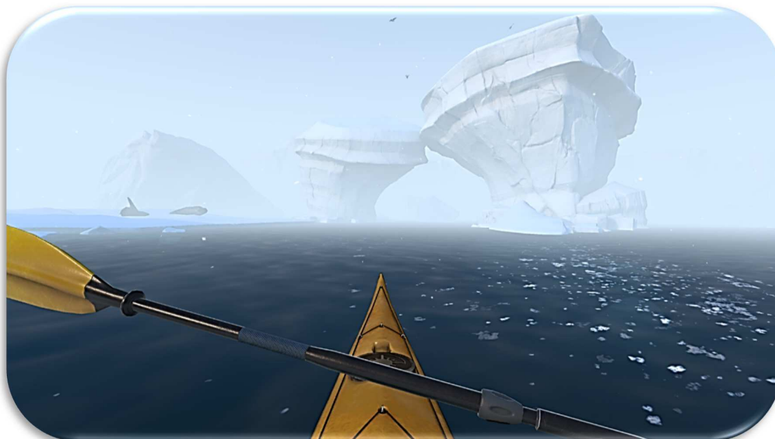
Capture d'écran de l'expérience virtuelle National Geographic VR