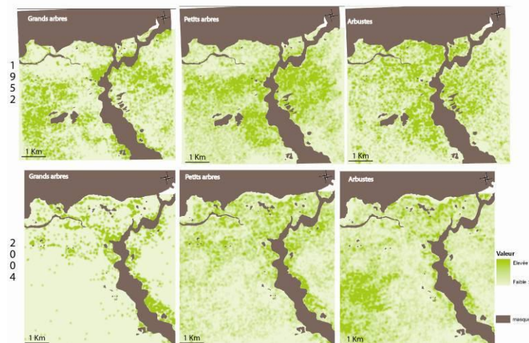
Figure 2. Densité de ligneux en 1952 et en 2004 (carroyage 100m). Région de Sadia

Dans une troisième étape, à partir de ces résultats spatialisés, nous avons généré des cartes des types de paysages et particulièrement des types de parcs agroforestiers en 2004 et en 1952. En effet, selon la part et la densité respective des trois classes de ligneux, auxquelles on ajoute celle des formations herbacées, on peut définir différents types de parcs. Pour cela nous avons calculé des densités de ligneux total et par type à partir de la carte des ligneux ponctuels sur la base d'une grille de 100 m de coté (figure 2).